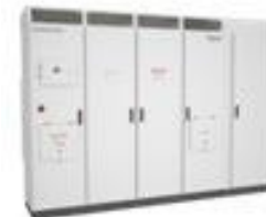
Conext Core XC-NA (500, 630, 680 kW) (1000 V)