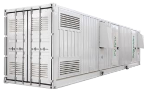
PV Box ST