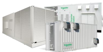
Специальные исполнения PVBox