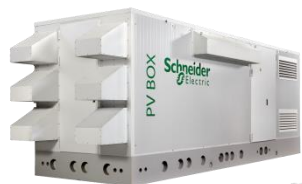
PV Box RT