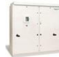
GT -NA (250, 500 kW) (600 V)