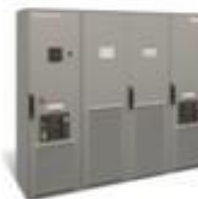
Conext Core XC (500, 630, 680 kW) (1000 V)